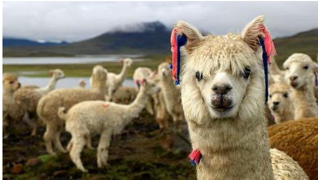
Alpacas en los Andes