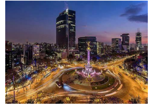
Ciudad de México