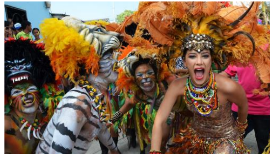
Carnaval de Baranquilla